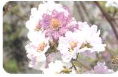
ดอกเสลา ดอกไม้ประจำจังหวัด