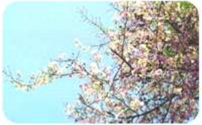
ต้นไม้ประจำจังหวัด